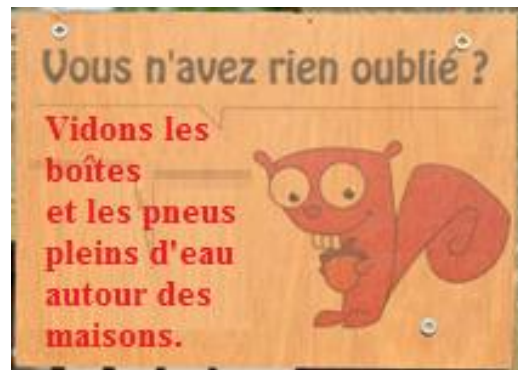
2. Un panneau présentant un message