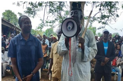
3. Une campagne de sensibilisation