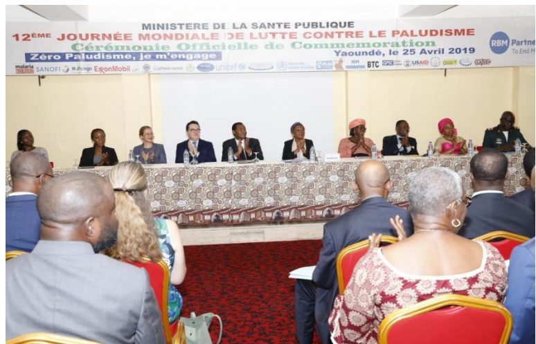
4. Une conférence portant sur la lutte contre le paludisme