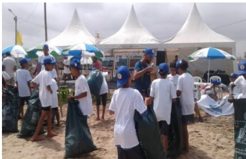
1. Une opération de salubrité