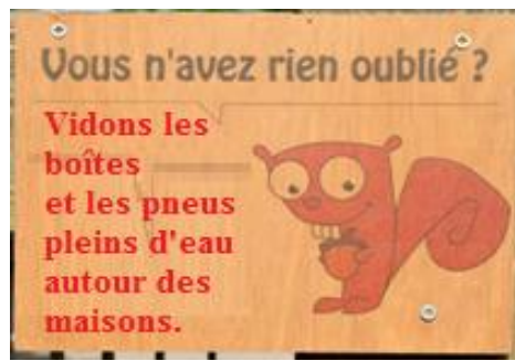
2. Un panneau présentant un message